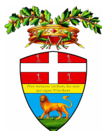
Provincia di Viterbo

Consulenti previdenziali assicurativi - Sede di lavoro: Provincia di Viterbo